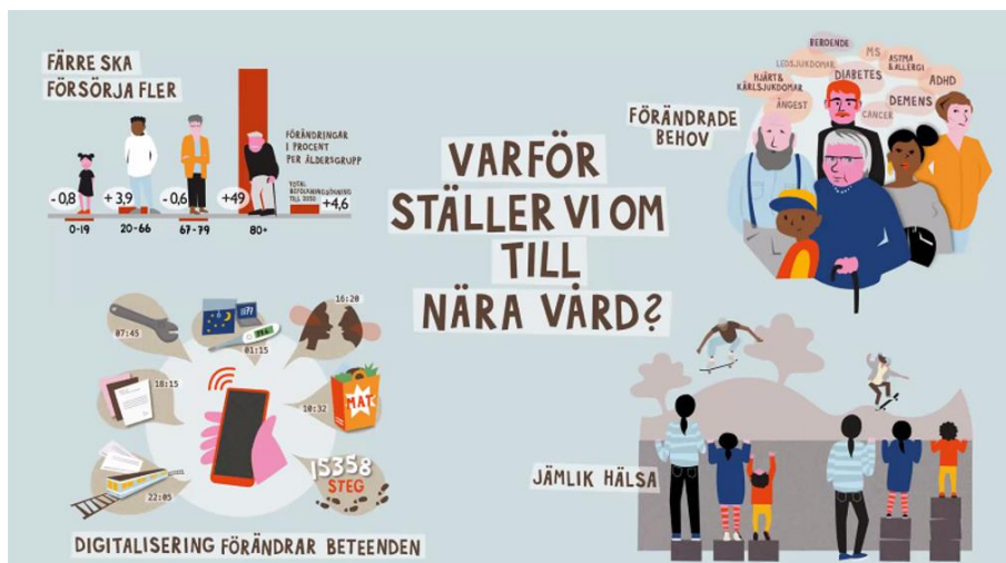
Illustration Sveriges Kommuner och Regioner

Antalet äldre ökar snabbt i Norrbotten och antalet i arbetsför ålder minskar. En mer tillgänglig, närmare vård kan tillsammans med nya arbetssätt innebära att resurserna inom vård och omsorg kan användas bättre och därmed räcka till fler.